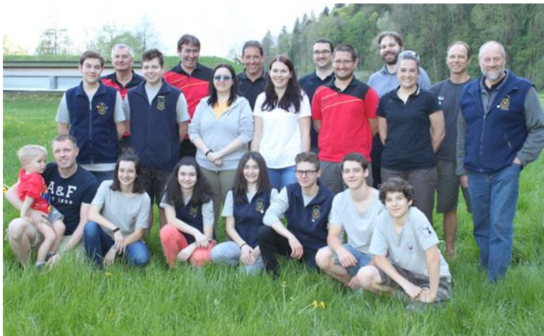
Die Tessiner Gäste zusammen mit den Glarner Gastgebern